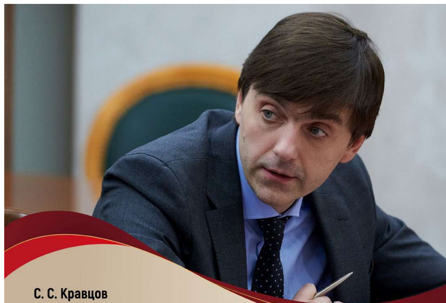
С. С. Кравцов

Я уверен, что Год педагога и наставника позволит нам реализовывать новые проекты по поддержке учителей, расширит возможности для творческой активности учителей.